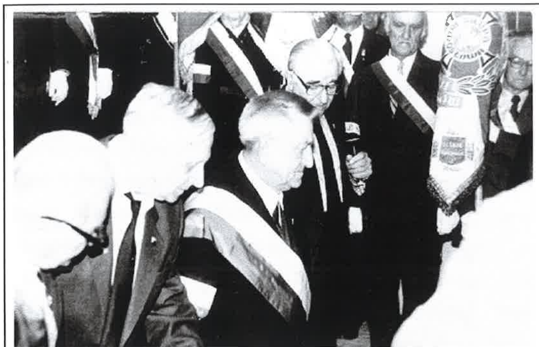
Ceremonia wbijania gwoździ pamiątkowych.

Następnie odbyła się ceremonia wbijania pamiątkowych gwoździ, w drzewce sztandaru.